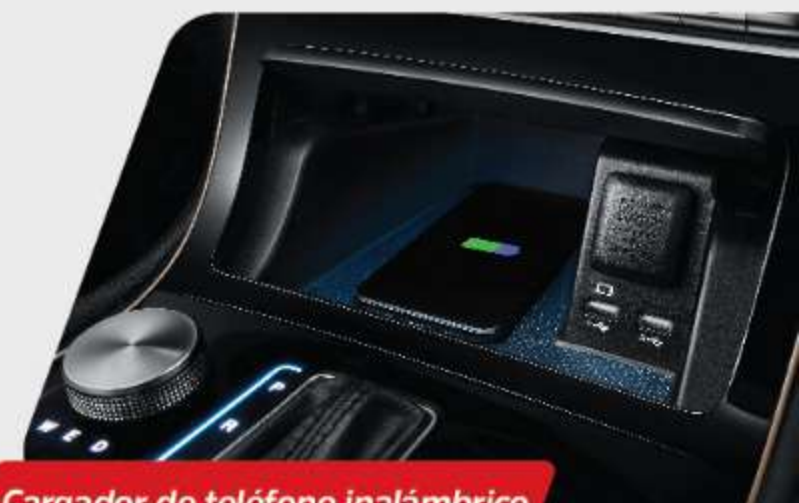
Cargador de teléfono inalámbrico