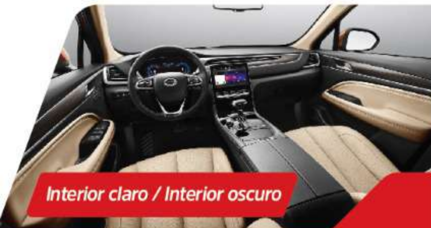
Interior claro / Interior oscuro