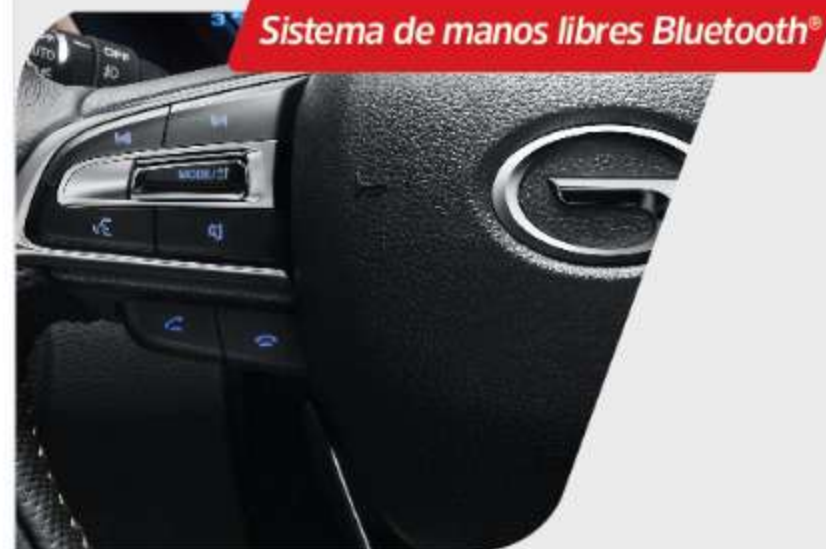
Sistema de manos libres Bluetooth®