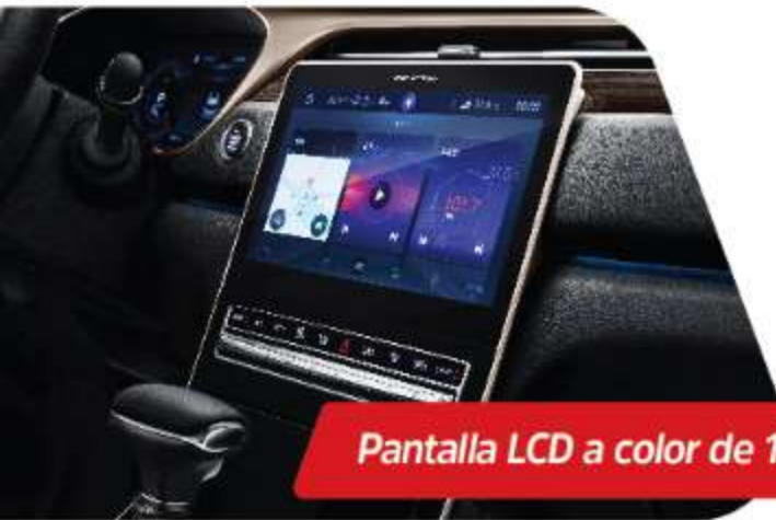
Pantalla LCD a color de 10.1"